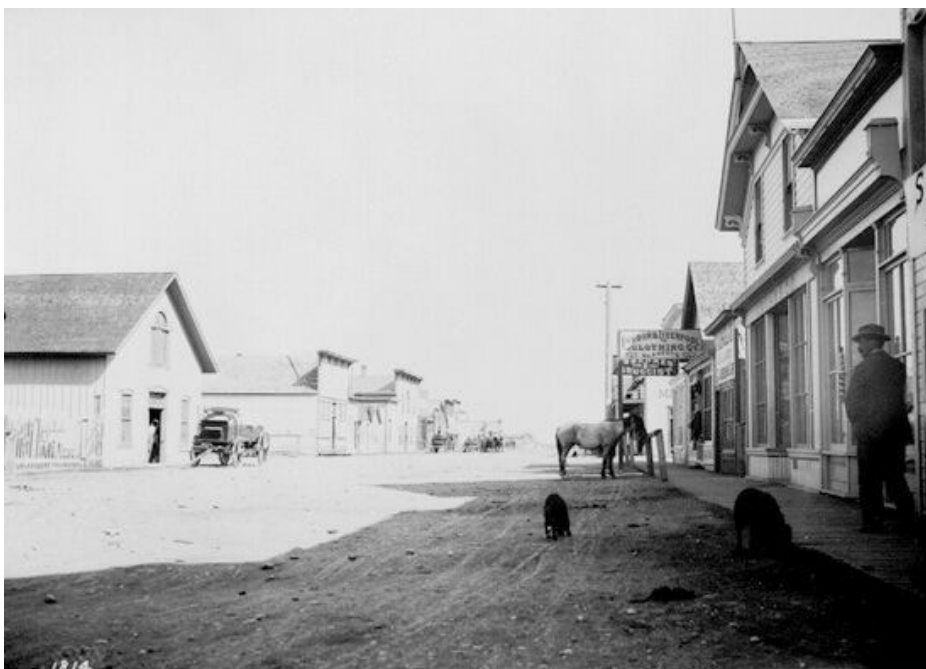
Figure 1 : Photo de la ville de MacLeod, en Alberta

En 1898, le District du Yukon est séparé des Territoires du Nord-Ouest pour devenir un territoire à lui seul. Aussi, les frontières du nord de la province de Québec sont changées en 1898.