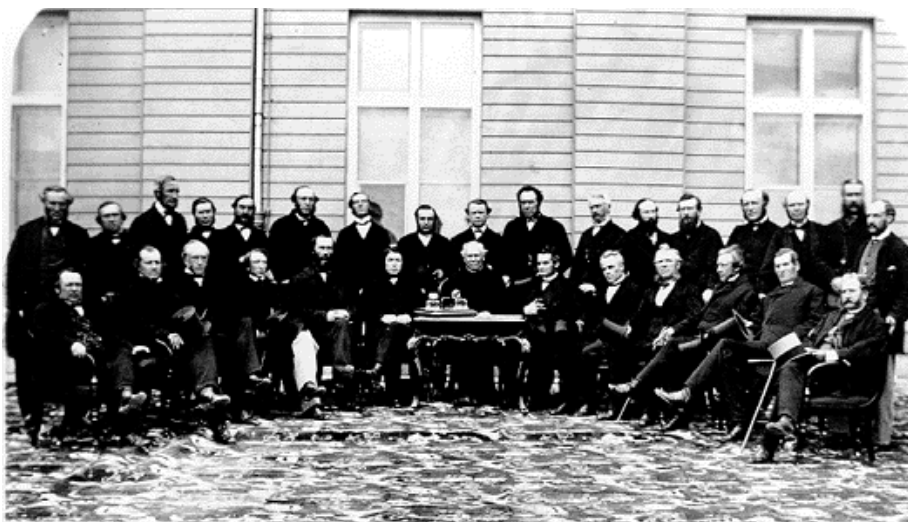
Figure 1 : Photo des Pères de la Confédération

Cartographier le pays fut une tâche difficile : le territoire est immense, le climat rude, et le pays connaît de longues périodes de guerre. Explorateurs et cartographes avancent à tâtons, commettent des erreurs, se contredisent, se perdent parfois en d'obscures théories sur la géographie de l'Amérique du Nord et n'obtiennent que lentement les renseignements recueillis par les géographes concurrents.