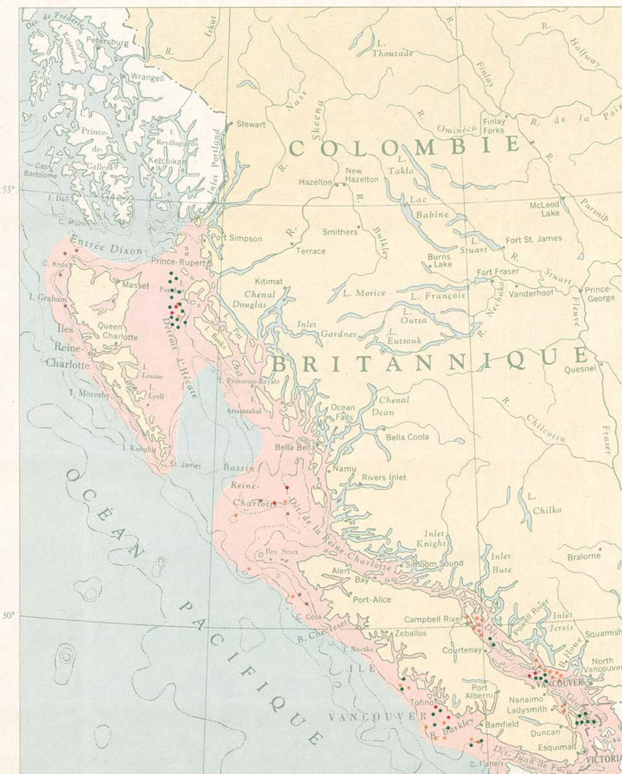
MORUE • MORUE LINGUE • MORUE GRISE • MORUE CHARBONNIÈRE • MORUE DE ROCHE Chaque point représente une prise annuelle de 62½ tonnes débarquées au Canada. Répartition