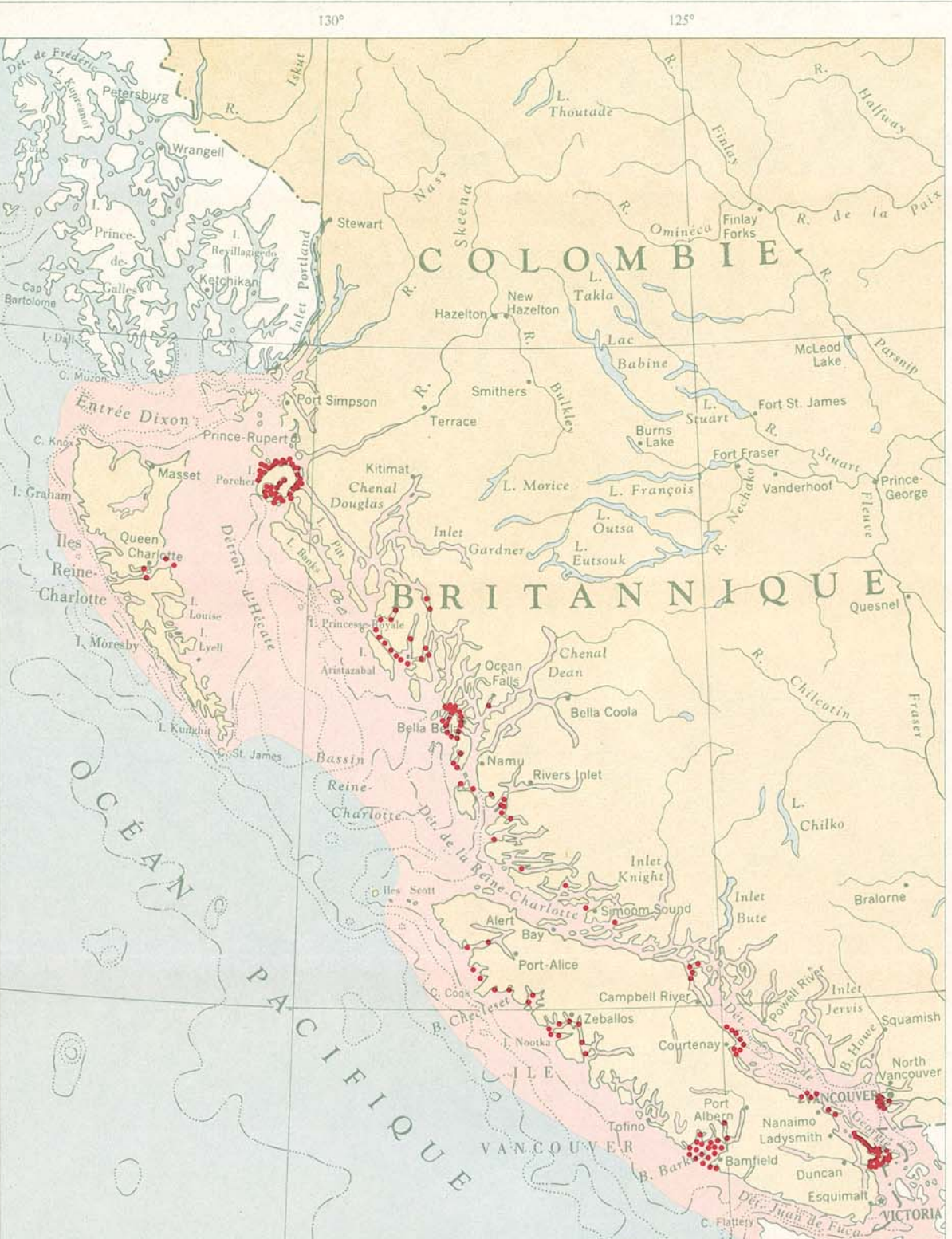
HARENG Chaque point représente une prise annuelle de 1.000 tonnes débarquées au Canada. Répartition