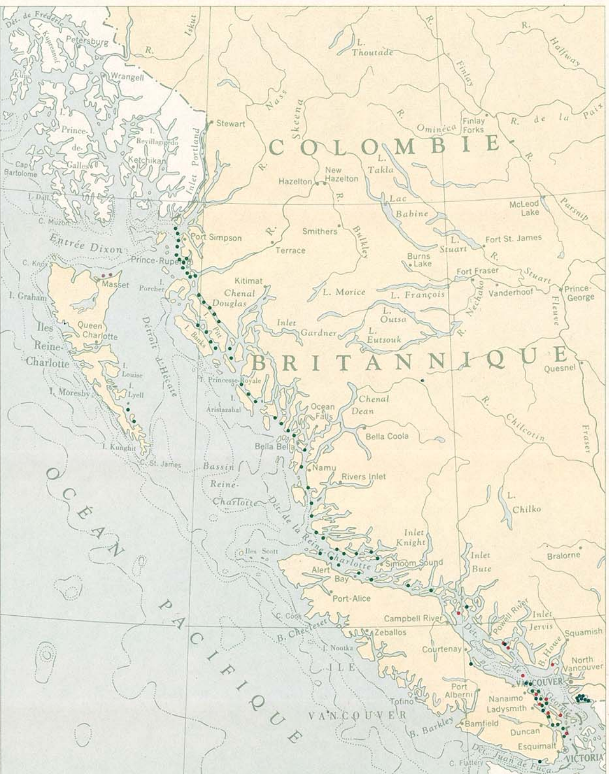
HÛTRES ET CLAMS • CLAMS JAUNES • COUSTEAUX Chaque point représente une prise annuelle de 50 tonnes débarquées au Canada. Répartition