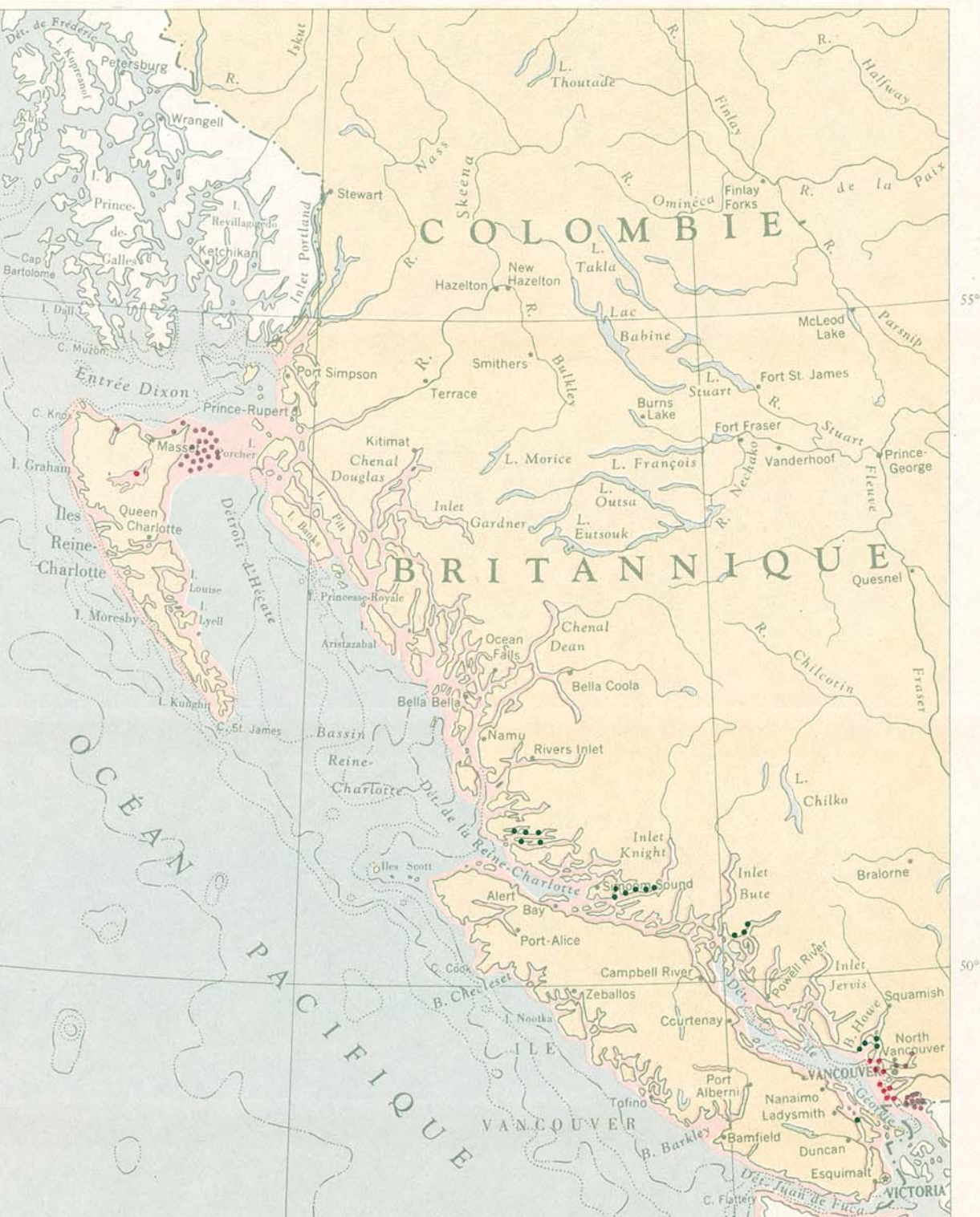
CRABES, CREVETTES GRISES ET ROSES • CRABES • CREVETTES GRISES • CREVETTES ROSES Chaque point représente une prise annuelle de 50.000 crabes débarqués au Canada. Chaque point représente une prise annuelle de 30 tonnes débarquées au Canada. Chaque point représente une prise annuelle de 1 tonne débarquée au Canada. Répartition