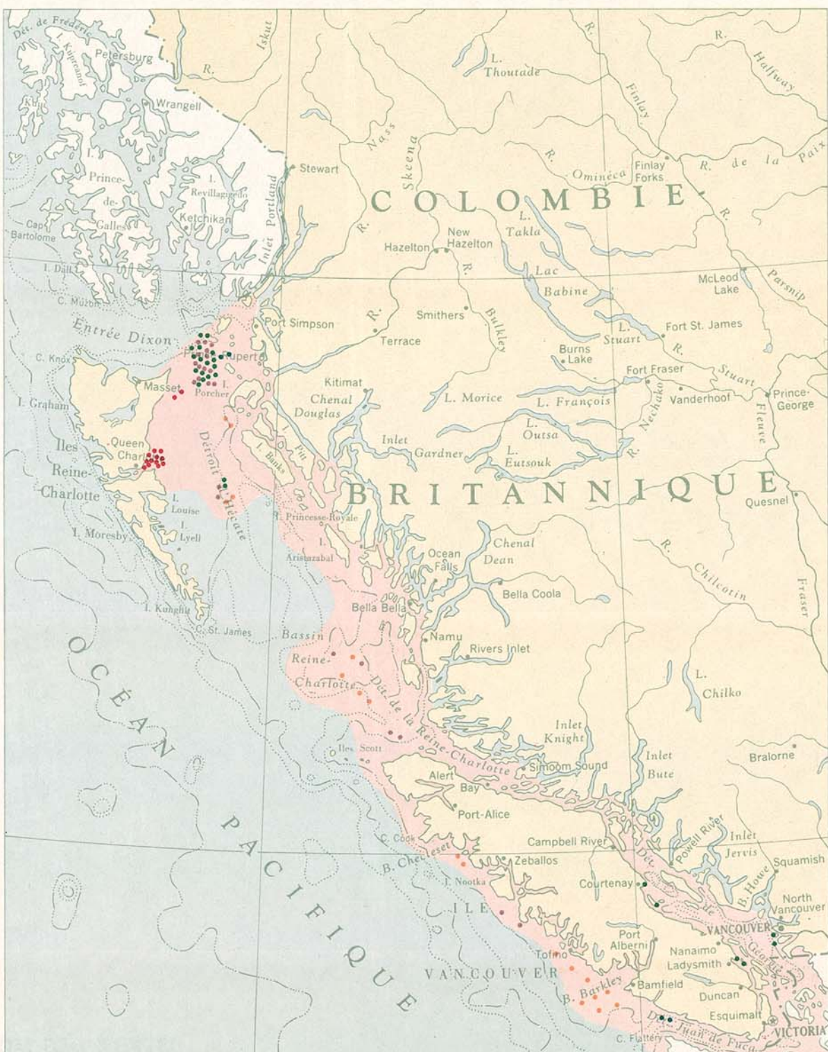
POISSONS PLATS • SOLE LIMANDE • SOLE DE ROCHE • SOLE JAUNE • SOLE DOVER • BARBUE Chaque point représente une prise annuelle de 62½ tonnes débarquées au Canada. Répartition