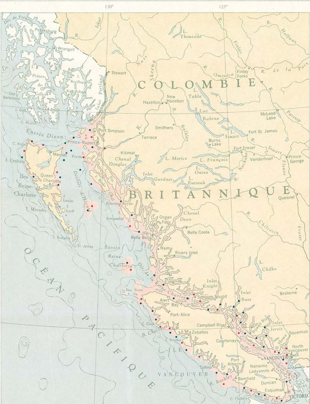
SAUMONS COHO ET QUINNAT • SAUMON COHO • SAUMON QUINNAT Chaque point représente une prise annuelle de 250 tonnes débarquées au Canada. Zones de pêche