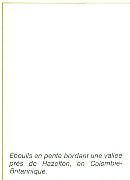
Éboulis en pente bordant une vallée près de Hazelton, en Colombie-Britannique.

De nos jours, quand nous parlons de glaciers, nous sommes portés à les situer uniquement dans l'Arctique ou les régions de hautes montagnes. Mais durant les diverses ères glaciaires, une bonne partie de l'hémisphère nord était recouverte de glaces. Nos Grands lacs ont été créés par la nappe glaciaire laurentienne qui recouvrit la moitié du continent nord-américain et dont le retrait date d'environ 10 000 ans. Non seulement l'invasion des glaces a-t-elle modifié le relief de notre pays, mais son poids énorme a enfoncé l'écorce terrestre, d'où la formation des immenses bassins que l'eau a comblés à la retraite des glaces.