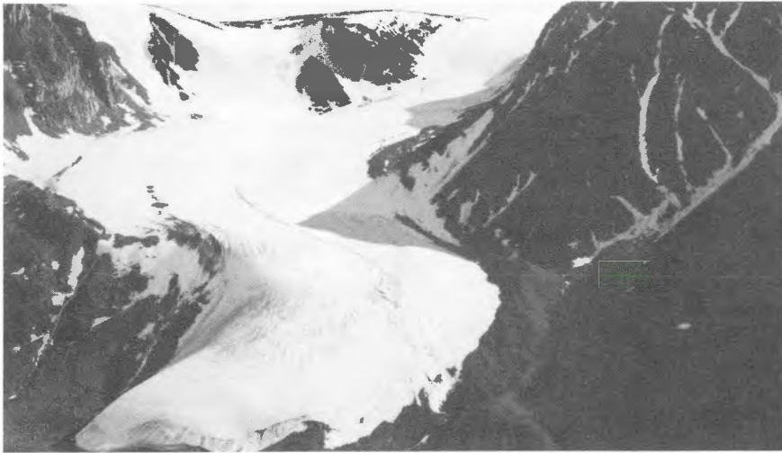
Glacier sur la rive ouest de l'inlet Navy Creek, au nord de l'île Baffin. Des débris de glaciers, ou moraine, se sont déposés en bordure du glacier.