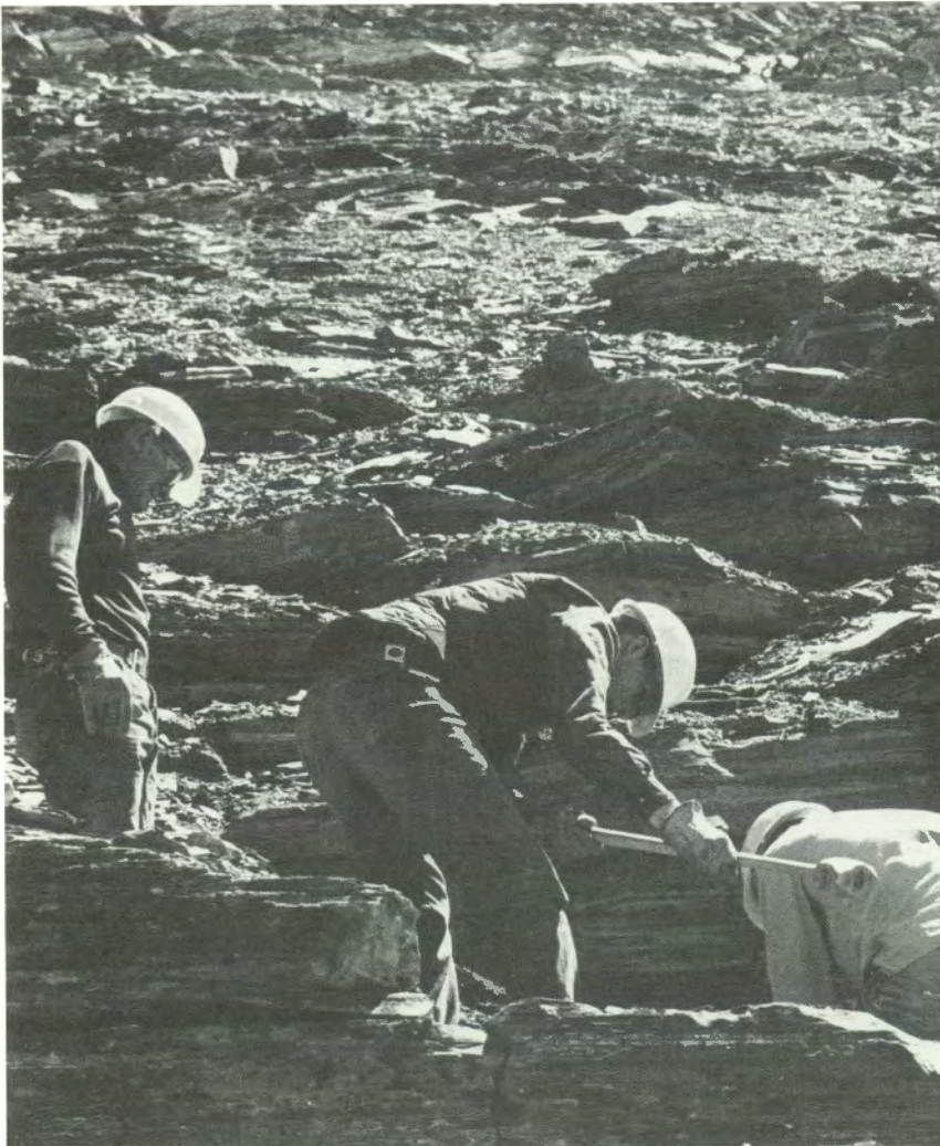
Géologues recueillant des échantillons de roches stratifiées dans la Cordillère.

Tout en favorisant la mise en valeur des immenses richesses minérales du Canada, la Commission géologique participe à l'inventaire de ses ressources en eau et en énergie. En fournissant des données sur les caractéristiques physiques et chimiques des structures rocheuses, du relief et du sous-sol, elle participe à la lutte contre la pollution et apporte une aide précieuse à la construction et à d'autres activités essentielles. La Commission géologique joue donc un rôle de tout premier ordre dans la gestion et l'utilisation optimales des richesses naturelles du Canada.