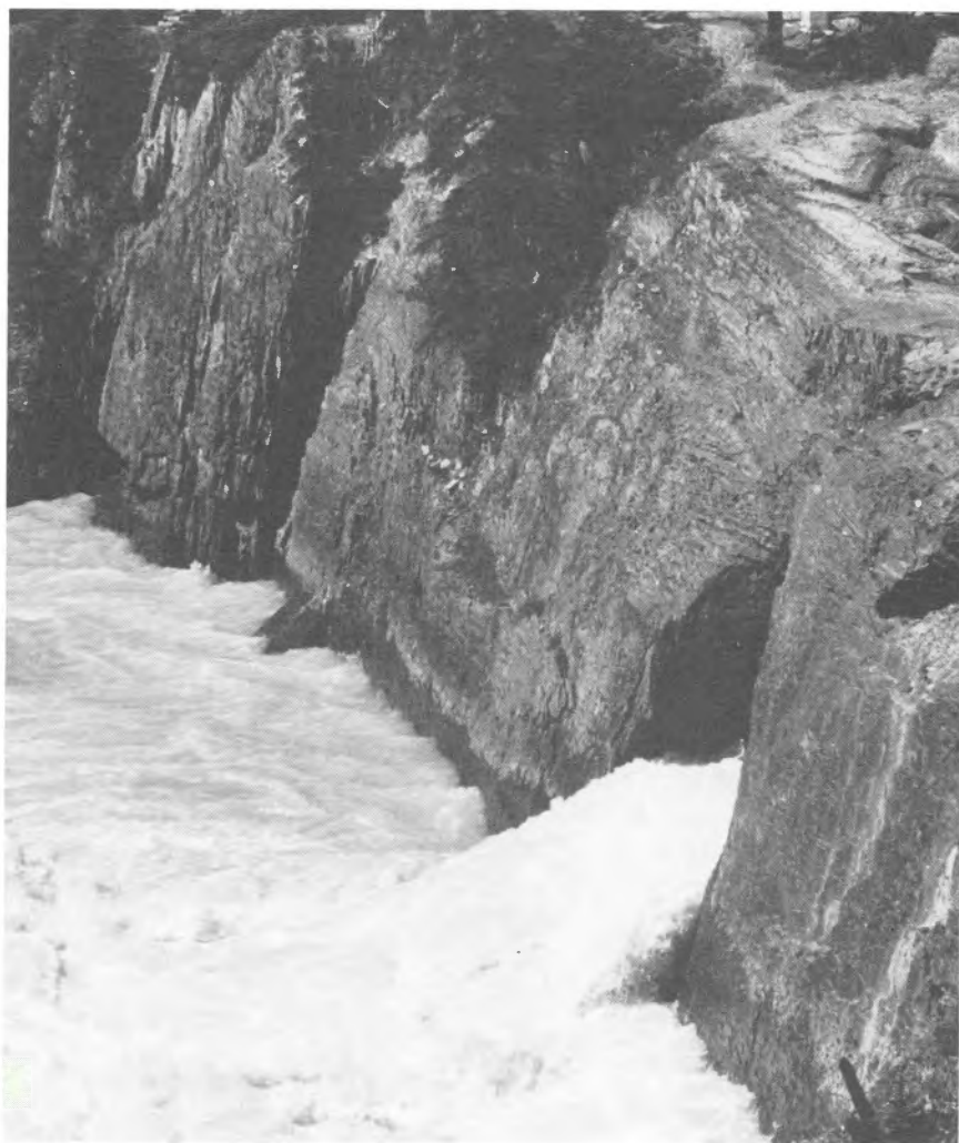
Une rivière au courant rapide s'est creusé un chemin dans le roc.

Dans leur course vers l'océan, les rivières rongent leurs berges, élargissant parfois leur bassin en ouvrant de nouveaux chenaux. Quant aux cours d'eau rapides, ils creusent leur lit alors que les dépôts s'amoncellent au fond des lacs et en réduisent la profondeur. Le même phénomène se produit le long des rives de nos lacs et sur le littoral de la mer lorsque vagues et courants balayent le rivage et déplacent d'énormes masses de sable.