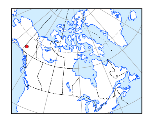
LOCATION MAP - CARTE DE LOCALISATION

Recommended citation: Kiss, F., 2012. Residual total magnetic field, Aeromagnetic Survey of the Scroggie Creek and Wolverine Creek Areas, NTS 115-O/6 and part of 115-O/7, Yukon Geological Survey of Canada, Open File 7183, Yukon Geological Survey, Open File 2012-20, scale 1:50,000. Nomenclature bibliographique conseillée: Kiss, F., 2012. Composante résiduelle du champ magnétique total, Levé aéromagnétique des régions du ruisseau Scroggie et du ruisseau Wolverine, SNRC 115-O/6 et partie de 115-O/7, Yukon Geological Survey of Canada, Dossier public 7183, Commission géologique du Yukon, Dossier public 2012-20, échelle 1:50 000.