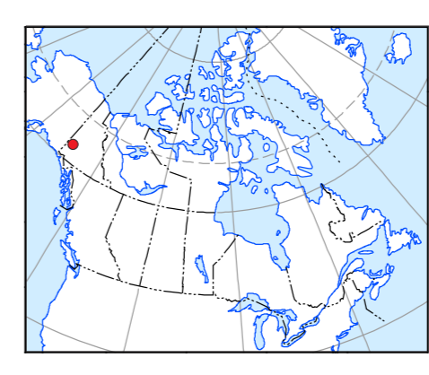
LOCATION MAP - CARTE DE LOCALISATION

Recommended citation: Kiss, F., 2012. Residual total magnetic field. Aeromagnetic Survey of the Scroggie Creek and Wolverine Creek Areas, NTS 115-O/2 and part of 115-O/3, Yukon. Geological Survey of Canada, Open File 7179; Yukon Geological Survey, Open File 2012-16, scale 1:50,000. Recommandation de citation: Kiss, F., 2012. Composante résiduelle du champ magnétique total. Levé aéromagnétique des régions du ruisseau Scroggie et du ruisseau Wolverine, SNRC 115-O/2 et partie de 115-O/3, Yukon. Commission géologique du Canada, Dossier public 7179; Commission géologique du Yukon, Dossier public 2012-16, échelle 1:50 000.