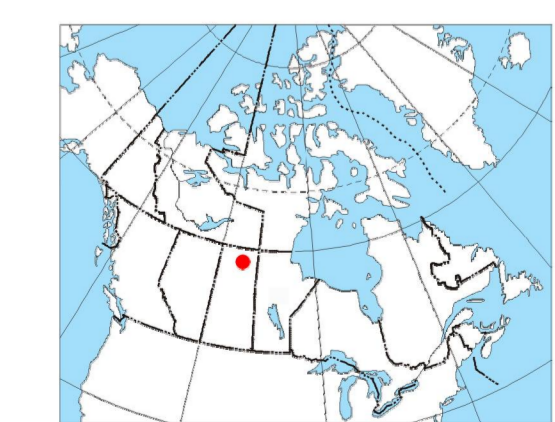
MAP LOCATION - LOCALISATION DE LA CARTE

Universal Transverse Mercator Projection Projection transverse universelle de Mercator Système de coordonnées géographiques Datum: NAD83 Datum: NAD83 Datum: NAD83