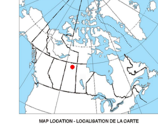
MAP LOCATION - LOCALISATION DE LA CARTE

Ce levé géophysique aéroporté et la production de cette carte ont été financés par le ministère de l'Énergie et des Ressources de la Saskatchewan et le programme GEM-Énergie du Secteur des sciences de la Terre, Ressources naturelles Canada.