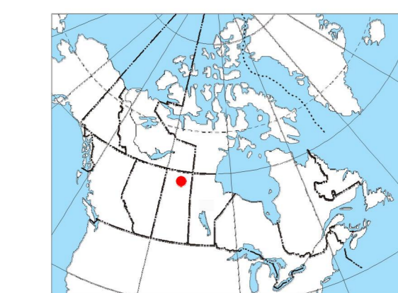
MAP LOCATION / LOCALISATION DE LA CARTE

Ce levé géophysique aéroporté et la production de cette carte ont été financés par le ministère de l'Énergie et des Ressources de la Saskatchewan et le programme GEM-Energie du Secteur des sciences de la Terre, Ressources naturelles Canada.