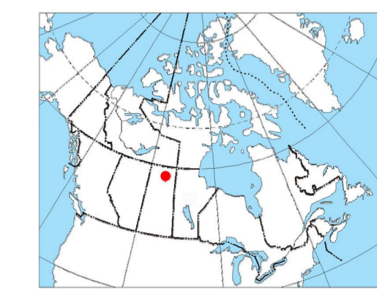
MAP LOCATION / LOCALISATION DE LA CARTE

Ce levé géophysique aéroporté et la production de cette carte ont été financés par le ministère de l'Énergie et des Ressources de la Saskatchewan et le programme GEM-Energie du Secteur des sciences de la Terre, Ressources naturelles Canada.