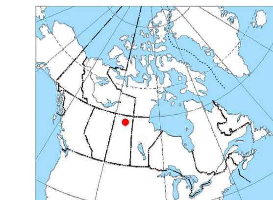
MAP LOCATION / LOCALISATION DE LA CARTE

Ce levé géophysique aéroporté et la production de cette carte ont été financés par le ministère de l'Énergie et des Ressources de la Saskatchewan et le programme GEM-Energie du Secteur des sciences de la Terre, Ressources naturelles Canada.