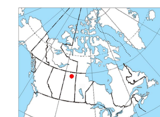
MAP LOCATION / LOCALISATION DE LA CARTE

Ce levé géophysique aéroporté et la production de cette carte ont été financés par le ministère de l'Énergie et des Ressources de la Saskatchewan et le programme GEM-Energie du Secteur des sciences de la Terre, Ressources naturelles Canada.