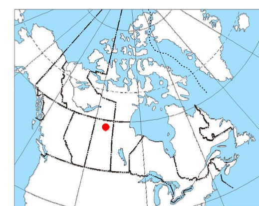
MAP LOCATION - LOCALISATION DE LA CARTE

Digital topographic data provided by Geomatics Canada, Natural Resources Canada / Données topographiques numériques de Géomatique Canada, Ressources naturelles Canada