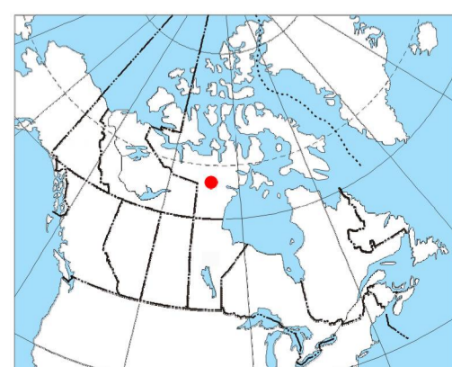
MAP LOCATION - LOCALISATION DE LA CARTE

L'acquisition, la compilation des données ainsi que la production des cartes furent effectuées par Goldak Airborne Surveys, Saskatoon, Saskatchewan. La gestion et la supervision du projet furent effectuées par la Commission géologique du Canada, Ottawa, Ontario.