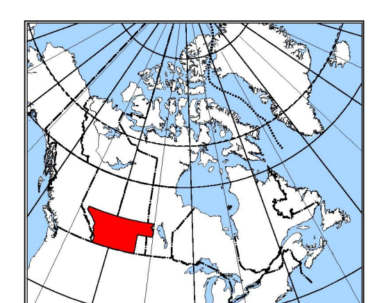
MAP LOCATION - LOCALISATION DE LA CARTE

Digital versions of this map and corresponding digital profile and gridded geophysical data by individual survey may be downloaded, at no charge, from Natural Resources Canada's Geoscience Data Repository for Geophysical and Geochemical Data at http://gdr.nrcan.gc.ca/gamma/ . The map and digital data are also available, for a fee, from the Geophysical Data Centre, Geological Survey of Canada, 615 Booth Street, Ottawa, Ontario, K1A 0E9, Telephone: (613) 995-5326, email: info@gdr.nrcan.gc.ca . Les versions numériques de ces cartes ainsi que les données géophysiques en formats « profil » et « maille » pour chaque levé peuvent être téléchargées gratuitement depuis le site de la Collection de données géophysiques et géochimiques de l'Entrepôt de données géoscientifiques de Ressources naturelles Canada ( http://gdr.nrcan.gc.ca/gamma/ ). La carte et les données numériques sont aussi disponibles, moyennant des frais, au Centre de données géophysiques de la Commission géologique du Canada au 615, rue Booth, Ottawa (Ontario) K1A 0E9, Téléphone : (613) 995-5326, courriel : info@gdr.nrcan.gc.ca .