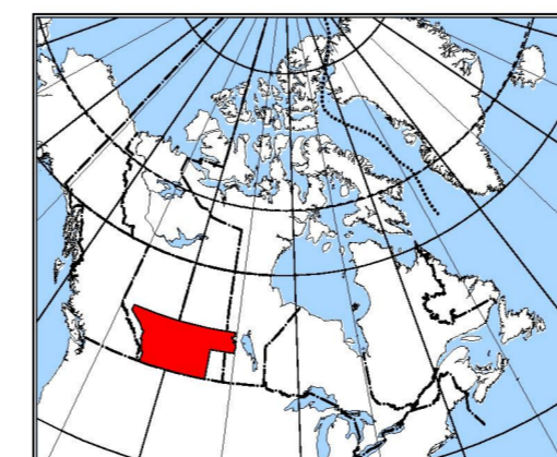
MAP LOCATION - LOCALISATION DE LA CARTE

Projection transverse universelle de Mercator Système de référence géodésique nord-américain, 1983 © Sa Majesté la Reine du chef du Canada 2011