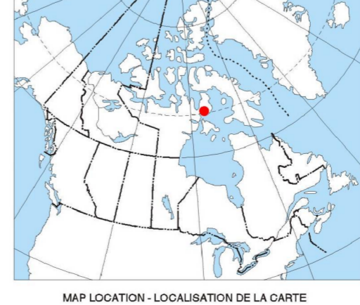
MAP LOCATION - LOCALISATION DE LA CARTE

Auteurs : Fortin R., Coyle M., Hefford S.W., Carson J.M., et Faulkner E.L. L'acquisition et la compilation des données, ainsi que la production des cartes, ont été effectuées par Terrapoint Ltd., Markham, Ontario. La gestion et la supervision du projet ont été effectuées par la Commission géologique du Canada, Ottawa, Ontario.