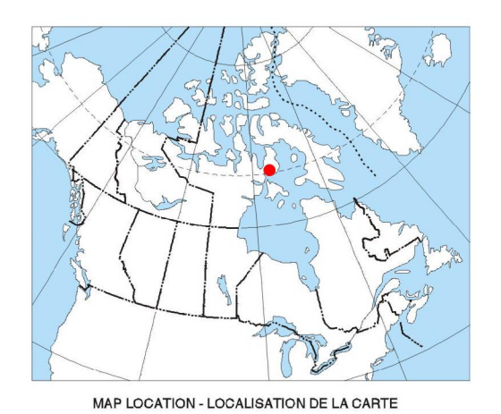
MAP LOCATION - LOCALISATION DE LA CARTE

On peut télécharger gratuitement, depuis l'Entrepôt de données géoscientifiques de Ressources naturelles Canada à l'adresse Web http://data.nrcan.gc.ca/ , des versions numériques de cette carte, des données numériques correspondantes en format profil et en format grille, ainsi que des données similaires issues des levés géophysiques adjacents. On peut se procurer les mêmes produits, moyennant des frais, en s'adressant au Centre des données géophysiques de la Commission géologique du Canada, 615, rue Booth, Ottawa (Ontario) K1A 0E8. Téléphone : (613) 965-5326, courriel : gdcc@nrcan.gc.ca