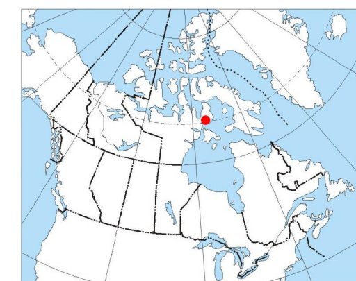
MAP LOCATION - LOCALISATION DE LA CARTE

Digital Topographic Data provided by Geomatics Canada, Natural Resources Canada Données topographiques numériques de Géomatique Canada, Ressources naturelles Canada