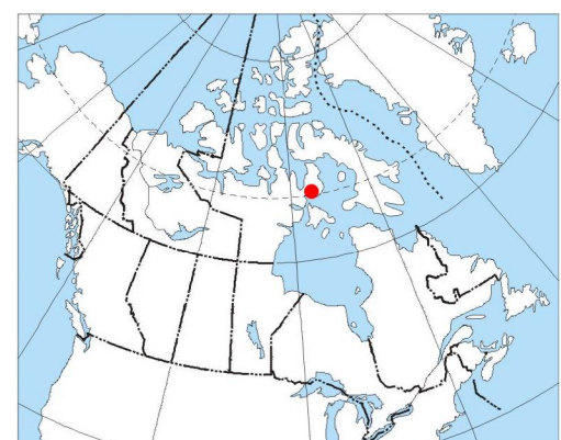
MAP LOCATION / LOCALISATION DE LA CARTE

L'acquisition et la compilation des données, ainsi que la production des cartes, ont été effectuées par Terrapoint Ltd., Markham, Ontario. La gestion et la supervision du projet ont été effectuées par la Commission géologique du Canada, Ottawa, Ontario.