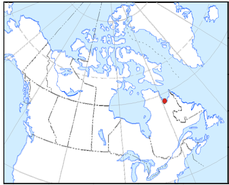
CARTE DE LOCALISATION - LOCATION MAP

This aeromagnetic survey and the production of this map were funded by the Geomapping for Energy and Minerals Program of the Earth Sciences Sector, Natural Resources Canada.