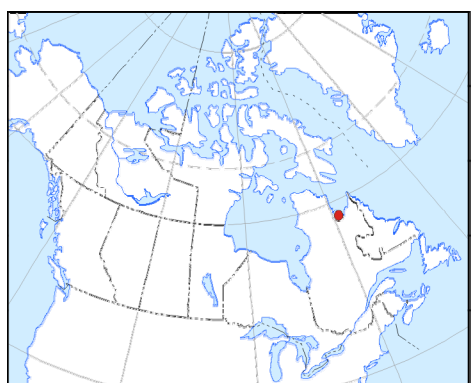
CARTE DE LOCALISATION - LOCATION MAP

This aeromagnetic survey and the production of this map were funded by the Geomapping for Energy and Minerals Program of the Earth Sciences Sector, Natural Resources Canada.