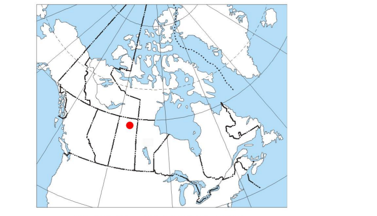
MAP LOCATION / LOCALISATION DE LA CARTE

This airborne geophysical survey and the production of this map were funded by the Saskatchewan Ministry of Energy and Resources and the GEM-Energy Program of the Earth Sciences Sector, Natural Resources Canada. Ce levé géophysique aéroporté et la production de cette carte ont été financés par le ministère de l'Énergie et des Ressources de la Saskatchewan et le programme GEM-Energie du Secteur des sciences de la Terre, Ressources naturelles Canada.