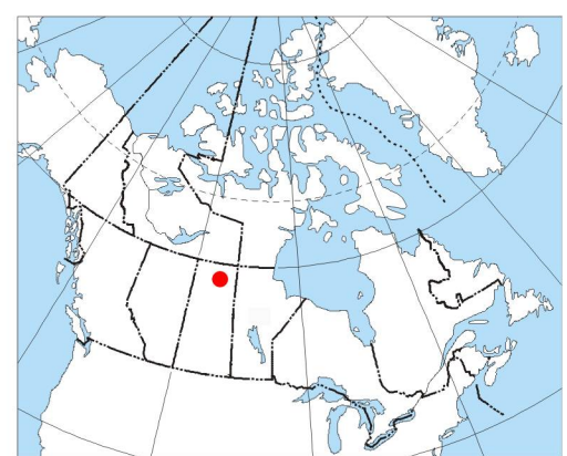
MAP LOCATION - LOCALISATION DE LA CARTE

L'acquisition, la compilation des données ainsi que la production des cartes furent effectuées par Goldak Airborne Surveys, Saskatoon, Saskatchewan. La gestion et la supervision du projet furent effectuées par la Commission géologique du Canada, Ottawa, Ontario.