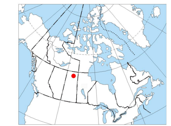
MAP LOCATION - LOCALISATION DE LA CARTE

On peut télécharger gratuitement, depuis la section sur les Données géoscientifiques de Ressources naturelles Canada à l'adresse Web http://gdr.nrcan.gc.ca , des versions numériques de cette carte, des données numériques correspondantes en format profil et en format maille, ainsi que des données similaires issues des levés aéromagnétiques et spectrométriques adjacents. On peut se procurer les mêmes produits, moyennant des frais, en s'adressant au Centre de données géophysiques de la Commission géologique du Canada, 615, rue Booth, Ottawa (Ontario) K1A 0E9, Téléphone : (613) 995-5326, courriel : info@gdr.nrcan.gc.ca .