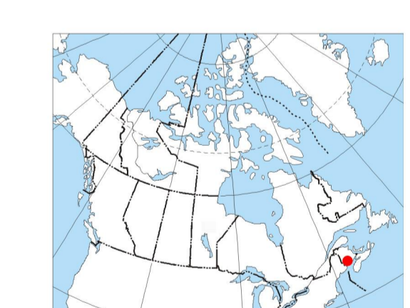
MAP LOCATION / LOCALISATION DE LA CARTE