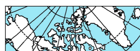
LOCATION MAP - CARTE DE LOCALISATION

Les versions numériques de ce cartes ainsi que les données géophysiques en format « profil » et « maille » et les grilles d'anomalies peuvent être téléchargées gratuitement depuis le site de la Collection de données géophysiques et géomagnétiques de l'Entrepo de données géophysiques de Ressources naturelles Canada ( http://digital.nrc.ca/geodata/ ). La carte et les données numériques sont aussi disponibles, moyennant des frais, au Centre de données géophysiques de la Commission géologique du Canada au 615, rue Booth, Ottawa (Ontario) K1A 0S3, Téléphone: (613) 996-3505, courriel: itlog@geoman.nrc.ca