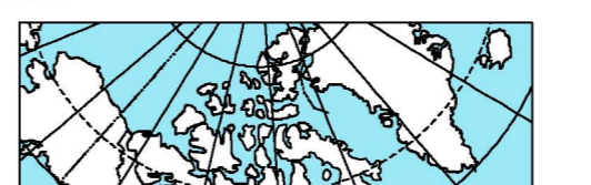
LOCATION MAP - CARTE DE LOCALISATION

Les versions numériques de ce cartes ainsi que les données géophysiques en formats « profil » et « maille » et les listes d'anomalies peuvent être téléchargées gratuitement depuis le site de la Collection de données géophysiques et géomorphologiques de l'Environnement de données géophysiques de Ressources naturelles Canada ( http://atlas.ccg.ca/geodata/ ). La carte et les données numériques sont aussi disponibles, moyennant des frais, au Centre de données géophysiques de la Commission géologique du Canada au 615, rue Booth, Ottawa (Ontario) K1A 0S3, Téléphone: (613) 993-3536, courriel: rlp@gsd.mcg.ca