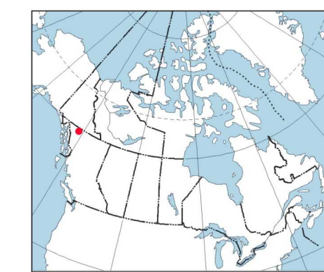
MAP LOCATION - LOCALISATION DE LA CARTE

Authors: Dumont, R., Potvin, J. et Kiss, F. L'acquisition, la compilation des données ainsi que la production des cartes furent effectuées par Goldak Airborne Surveys, Saskatoon, Saskatchewan. La gestion et la supervision du projet furent effectuées par la Commission géologique du Canada, Ottawa, Ontario.