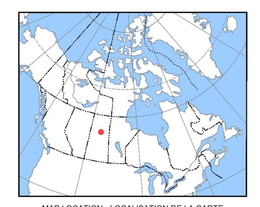
MAP LOCATION - LOCALISATION DE LA CARTE

L'acquisition, la compilation des données ainsi que la production des cartes furent effectuées par Fugro Airborne Surveys, Ottawa, Ontario. La gestion et la supervision du projet furent effectuées par la Commission géologique du Canada, Ottawa, Ontario.