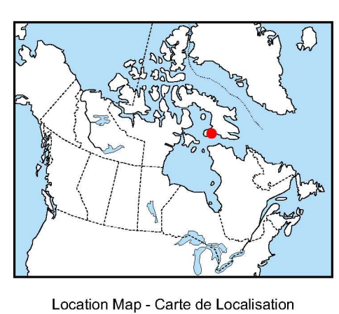
Location Map - Carte de Localisation

Recommended citation: Dumont R., Potvin J., 2006; Residual magnetic total field, Aeromagnetic survey Baffin Island 2005, NTS 36 B/12, Nunavut, Geological Survey of Canada, Open File 5206, scale 1:50 000.