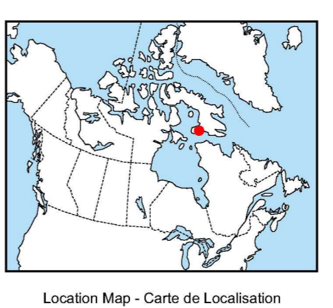
Location Map - Carte de Localisation