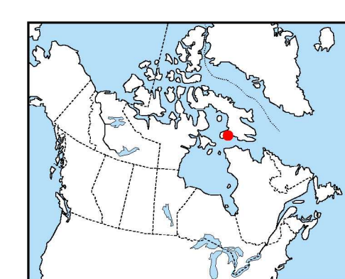
Location Map - Carte de Localisation

L'acquisition, ainsi que la compilation des données et la production des cartes furent effectuées par Sander Geophysics, Ottawa, Ontario. La gestion et supervision du projet furent effectuées par la Commission géologique du Canada, Ottawa, Ontario.