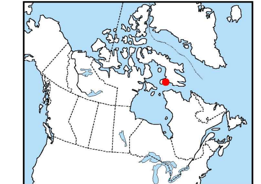
Location Map - Carte de Localisation

L'acquisition, ainsi que la compilation des données et la production des cartes furent effectuées par Sander Geophysics, Ottawa, Ontario. La gestion et supervision du projet furent effectuées par la Commission géologique du Canada, Ottawa, Ontario.