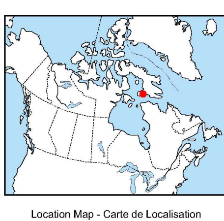
Location Map - Carte de Localisation