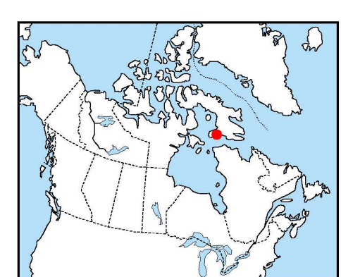
Location Map - Carte de Localisation

L'acquisition, ainsi que la compilation des données et la production des cartes furent effectuées par Sander Geophysics, Ottawa, Ontario. La gestion et supervision du projet furent effectuées par la Commission géologique du Canada, Ottawa, Ontario.