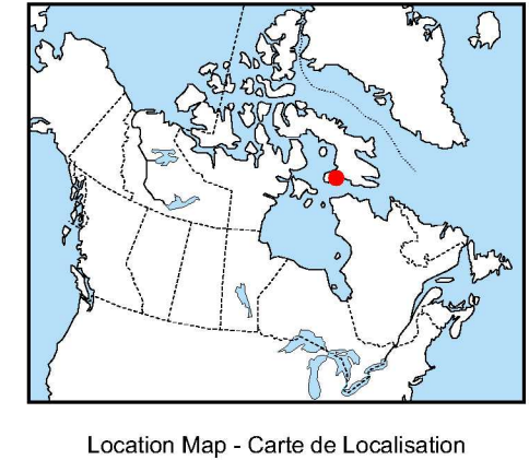
Location Map - Carte de Localisation

L'acquisition, ainsi que la compilation des données et la production des cartes furent effectuées par Sander Geophysics, Ottawa, Ontario. La gestion et supervision du projet furent effectuées par la Commission géologique du Canada, Ottawa, Ontario.