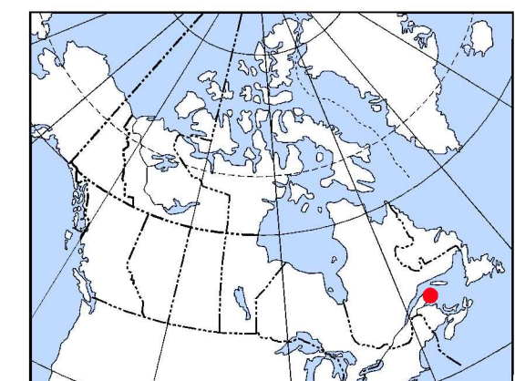
LOCALISATION DE LA CARTE - MAP LOCATION

Projection: Transverse Mercator Système de référence géodésique: NAD83 © Her Majesty the Queen in Right of Canada 2004