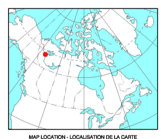
MAP LOCATION - LOCALISATION DE LA CARTE

Recommended citation: Dumont R. Geological Survey of Canada 2000 : Aeromagnetic Total Field Map Northwest Territories: NTS 96D/NW Open File 3759I scale 1:100 000 Notation bibliographique conseillée: Dumont R. Commission géologique du Canada 2000 : Carte aéromagnétique du champ total Territoires du Nord-Ouest : NTS 96D/NW Dossier public 3759I échelle 1:100 000