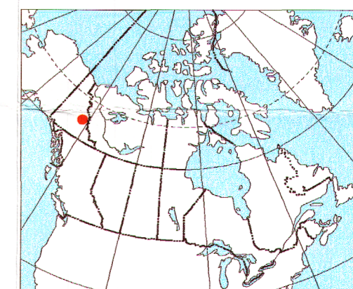
MAP LOCATION - LOCALISATION DE LA CARTE

Cette carte fait partie d'un ensemble de cartes révisées à partir de la publication originale de 1968. Cette révision a consisté à numériser les cartes originales le long des lignes de vol à l'intersection des isomagnétiques. Les lignes à problèmes furent re-numérisées à partir des documents originaux. Des ajustements de synchronisation corrigèrent les erreurs de localisation furent appliqués avant de renumérer ces lignes. Ces cartes furent réimprimées avec des nouveaux isomagnétiques en incluant un texte explicatif similaire au texte original.