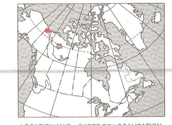
LOCATION MAP - CARTE DE LOCALISATION