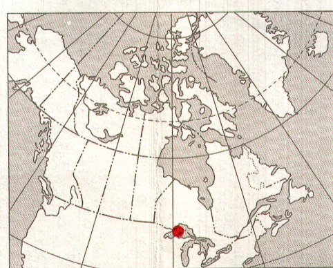
INDEX MAP - LIEU DE LA CARTE

On peut obtenir des exemplaires de cette carte en s'adressant à la Commission géologique du Canada aux adresses suivantes: 601, rue Booth, Ottawa, Ontario K1A 0E9 3303-33rd Street, N.W., Calgary, Alberta T2L 2A7. Publié en 1989.