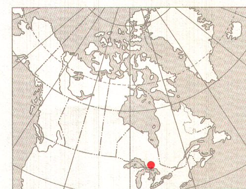
INDEX MAP - LIEU DE LA CARTE

On peut obtenir des exemplaires de cette carte en s'adressant à la Commission géologique du Canada aux adresses suivantes : 601, rue Booth, Ottawa, Ontario K1A 0E8, 3303-33rd Street, N.W., Calgary, Alberta T2L 2A7. Révisé en 1989.