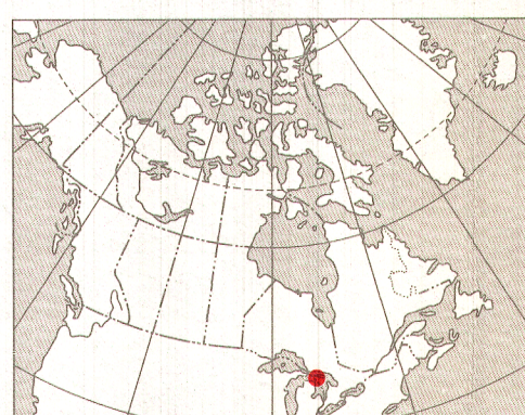
INDEX MAP - LIEU DE LA CARTE

On peut obtenir des exemplaires de cette carte en s'adressant à la Commission géologique du Canada aux adresses suivantes : 601, rue Booth, Ottawa, Ontario K1A 0E8 3303-33 e Street, N.W., Calgary, Alberta T2L 2A7 Révisé en 1988