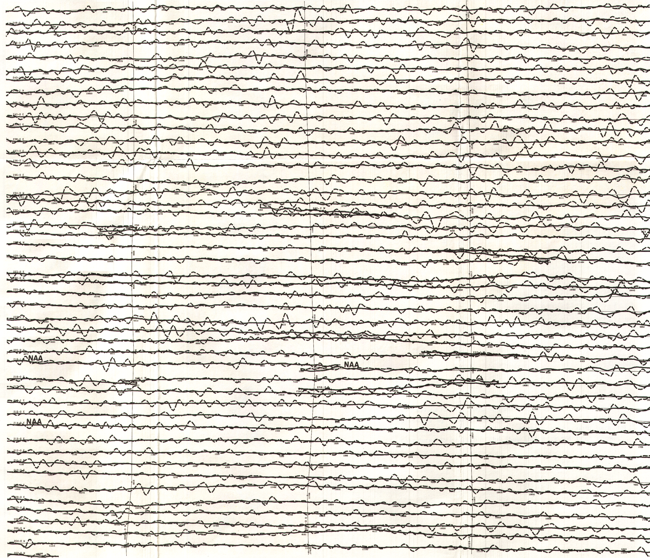
TOTEM VLF EM PROFILES FOR LINE STATION PROFILS DE TOTEM EM VLF POUR LA STATION EN LIGNE