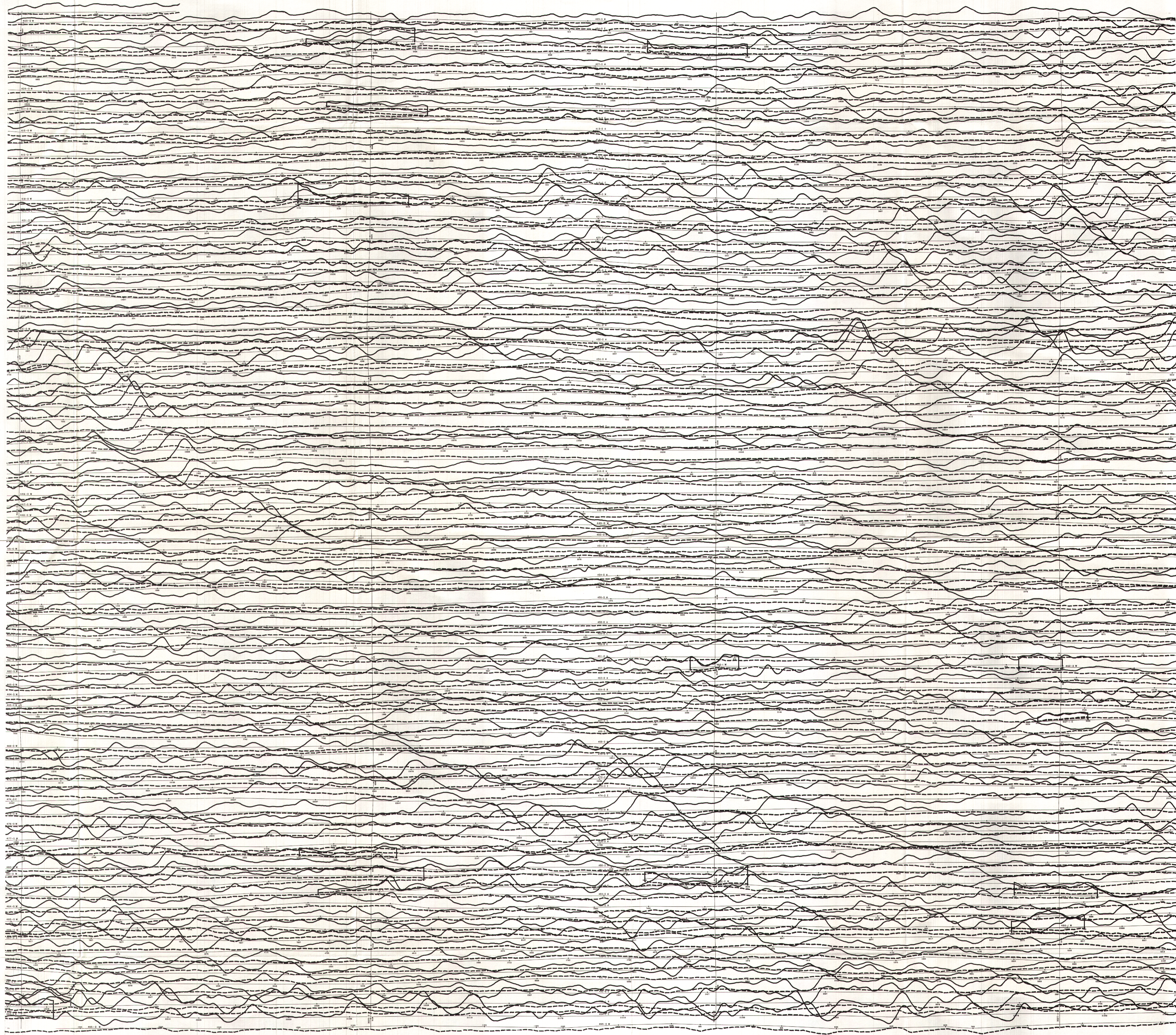
TOTEM VLF EM PROFILES FOR LINE STATION (Annapolis) PROFILS DE TOTEM EN VLF POUR LA STATION EN LIGNE (Annapolis)