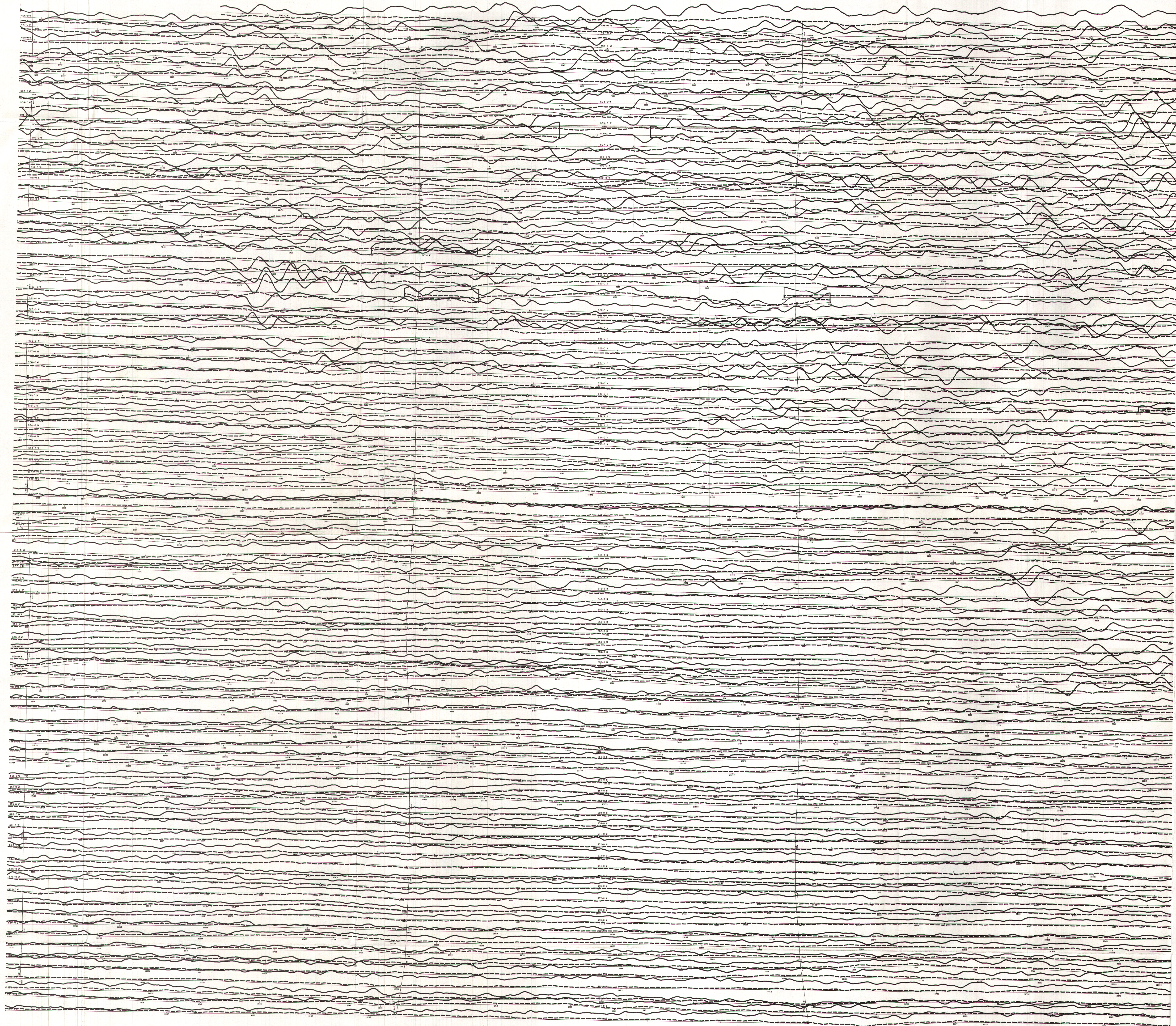
TOTEM VLF EM PROFILES FOR LINE STATION ( Annapolis ) PROFILS DE TOTEM EM VLF POUR LA STATION EN LIGNE ( Annapolis )