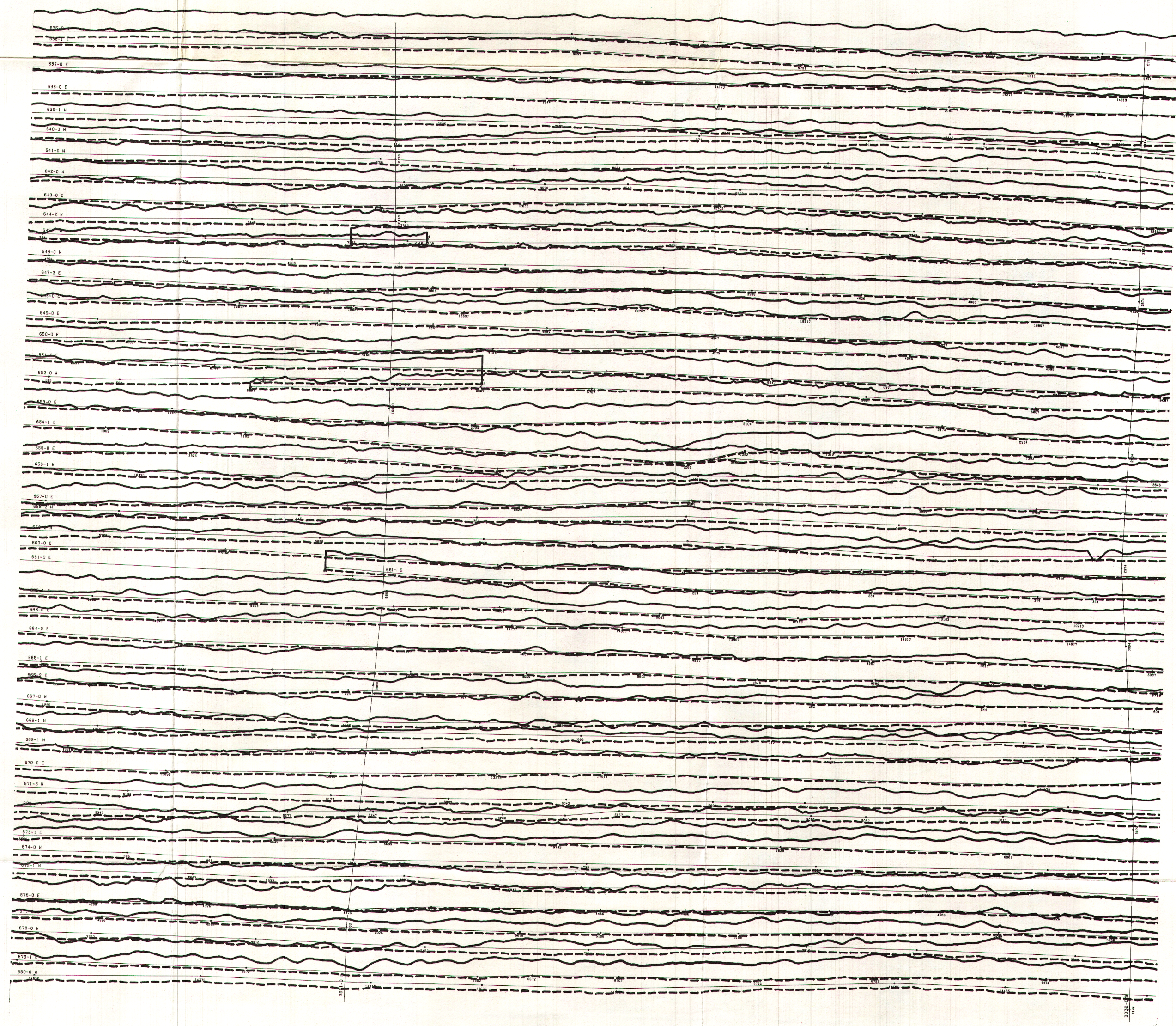
TOTEM VLF EM PROFILES FOR LINE STATION ( Annapolis ) PROFILS DE TOTEM VLF POUR LA STATION EN LIGNE ( Annapolis )