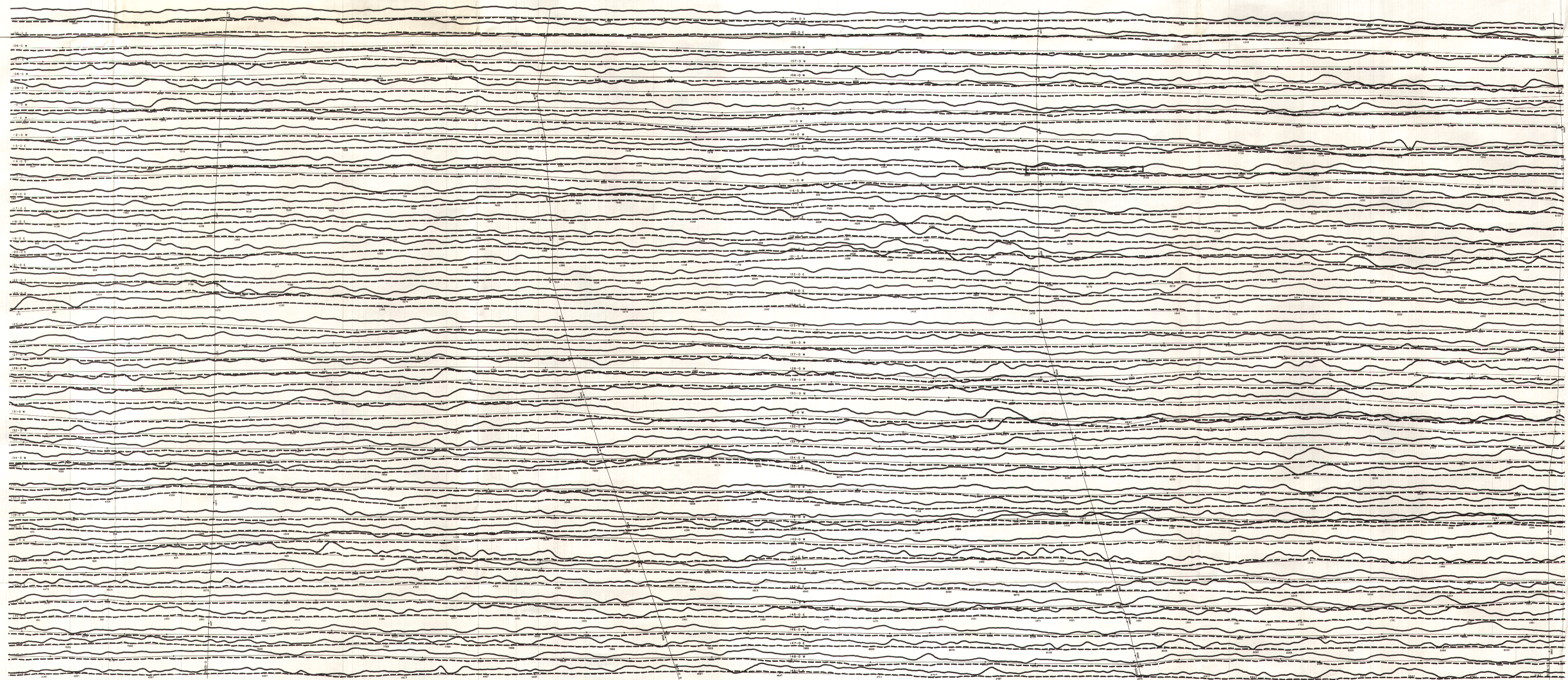
TOTEM VLF EM PROFILES FOR LINE STATION (Annapolis) PROFILS DE TOTEM EM VLF POUR LA STATION EN LIGNE (Annapolis)