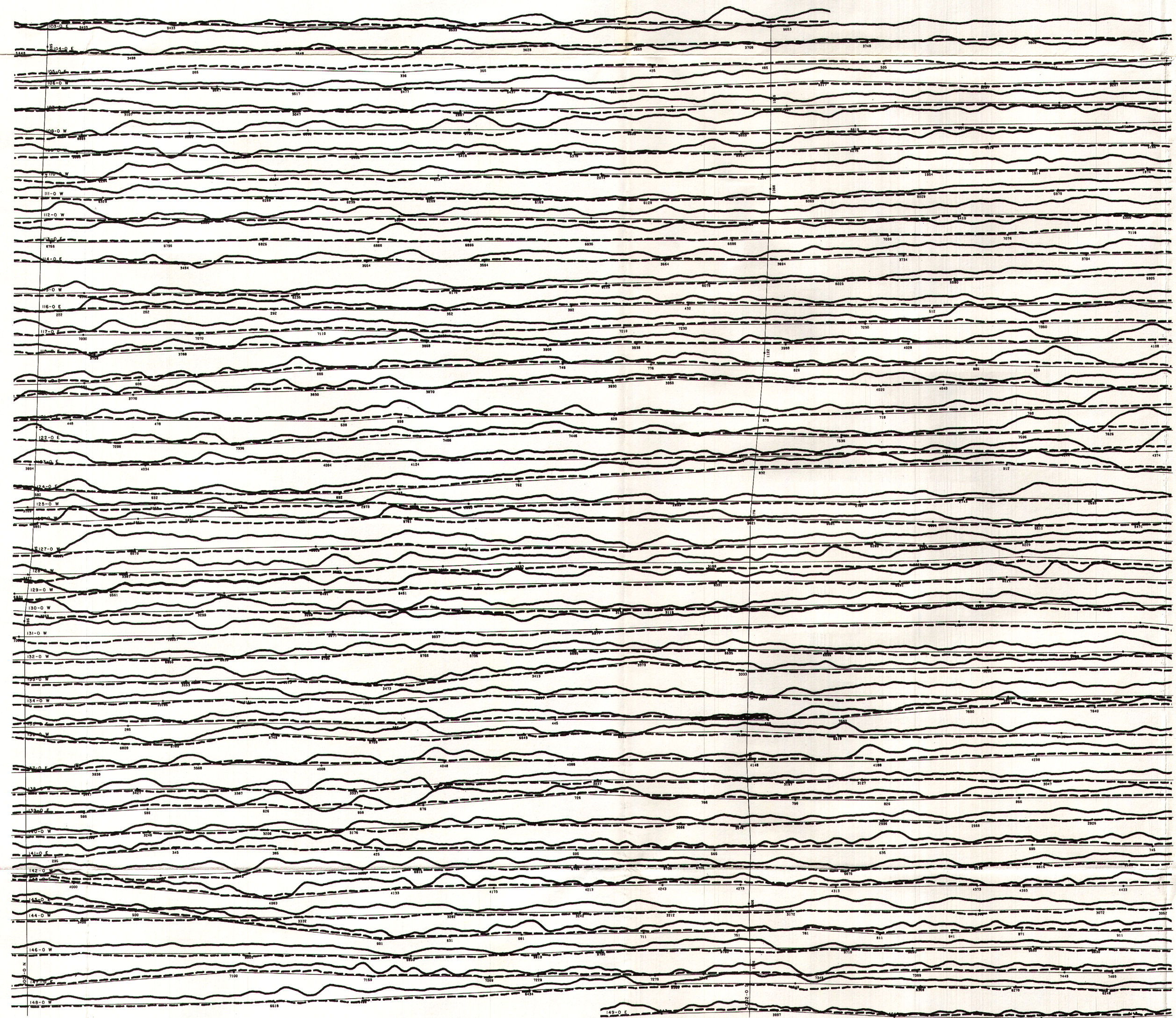
TOTEM VLF EM PROFILES FOR LINE STATION (Annapolis) PROFILS DE TOTEM EM VLF POUR LA STATION EN LIGNE (Annapolis)