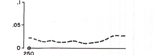
QUADRATURE PROFILE PROFIL DE QUADRATURE

Solid line is total field VLF Scale is 1 cm. = 20% Le trait continu représente le champ total VLF L'échelle est de 1 cm = 20%